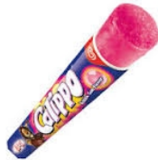
Bubble Gum 2.50